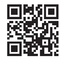
Ersatzhaltestelle Richtung Pasing (S-Bahn und Regio)

www.mvv-muenchen.de © MVV Stand: März 2024 Zeichnung ohne Maßstab