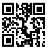
Ersatzhaltestelle Richtung Zoologischer Garten

Verlassen Sie den Bahnsteig in Richtung Ausgang Europaplatz und begeben Sie sich an die Invalidenstraße. Halten Sie sich rechts und folgen dem Straßenverlauf bis zur jeweiligen Ersatzhaltestelle.